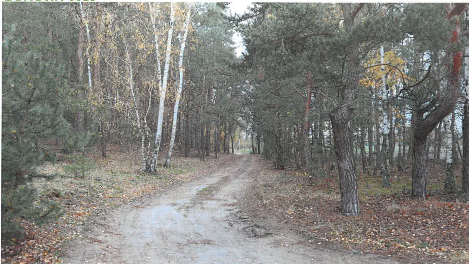
Las i leśna droga w Leszczycy.