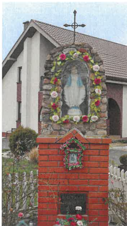
Krzyż i kapliczka przydrożna w Leszczycy.