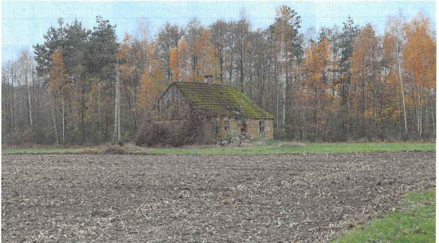
Opuszczona chata pod lasem w Leszczycy.