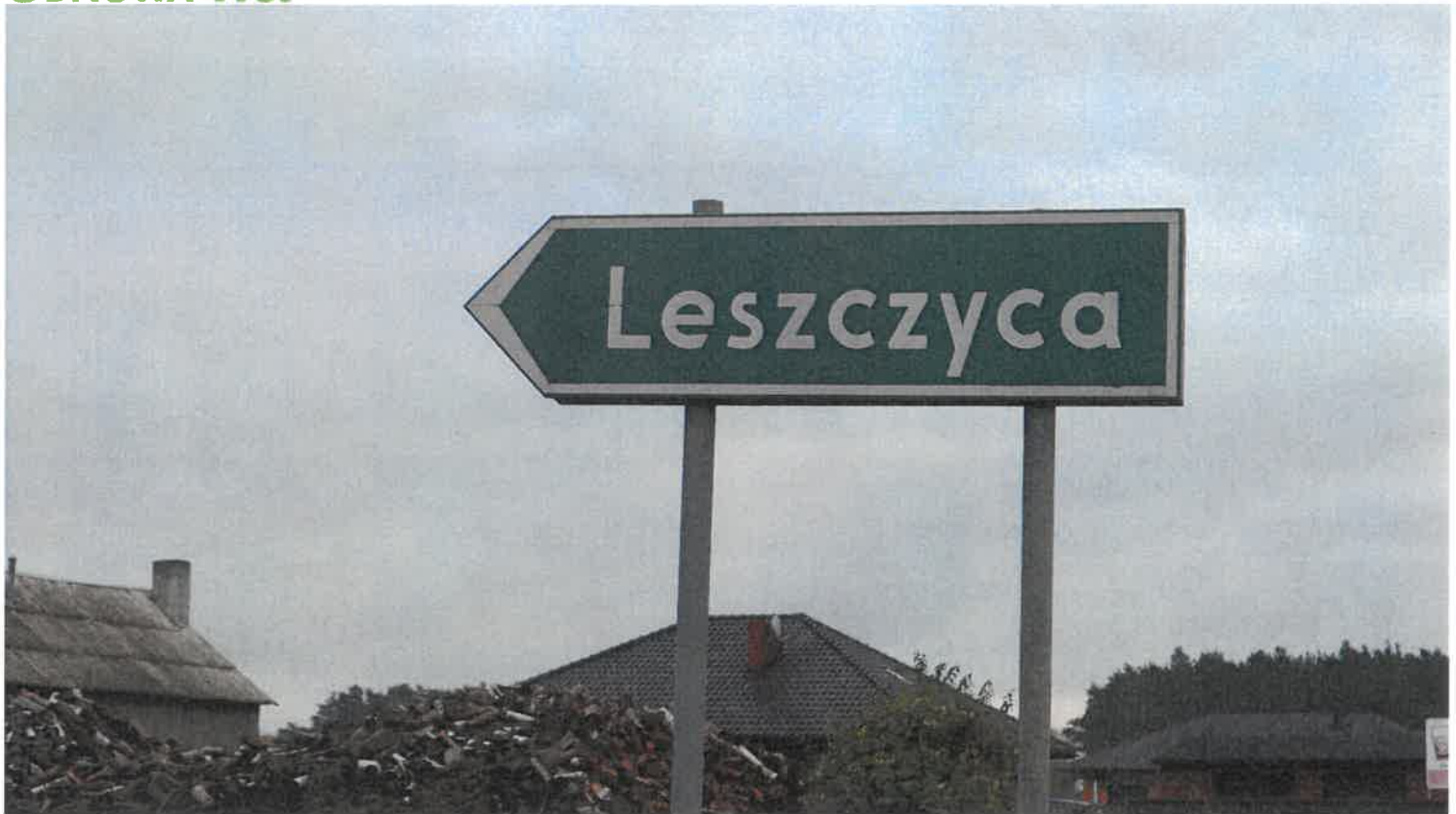
Tablica z nazwą miejscowości przy wjeździe do sołectwa.