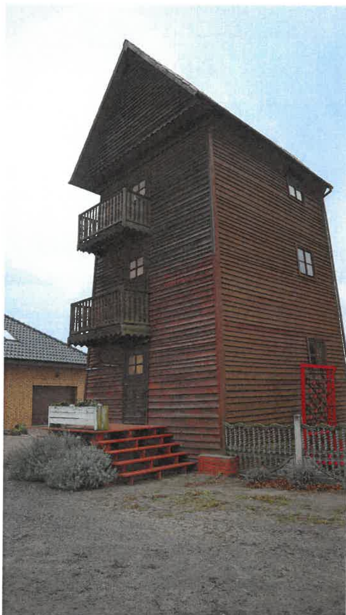
Zabytkowy wiatrak na prywatnej posesji w Leszczycy.