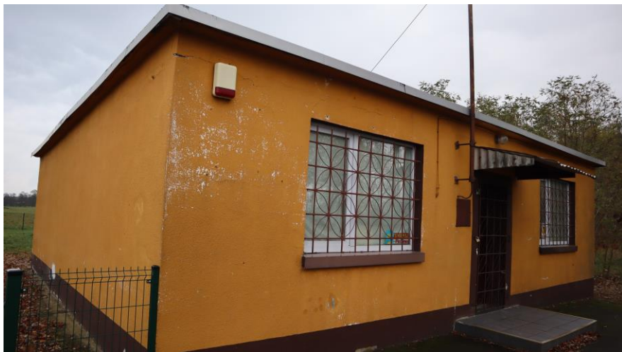
Niezagospodarowany budynek po dawny sklepie spożywczym