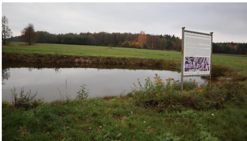
Odkrywka rudy żelaza