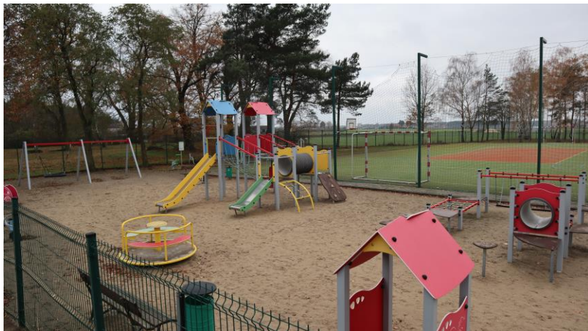
Plac zabaw i siłownia zewnętrzna w Wierzchach