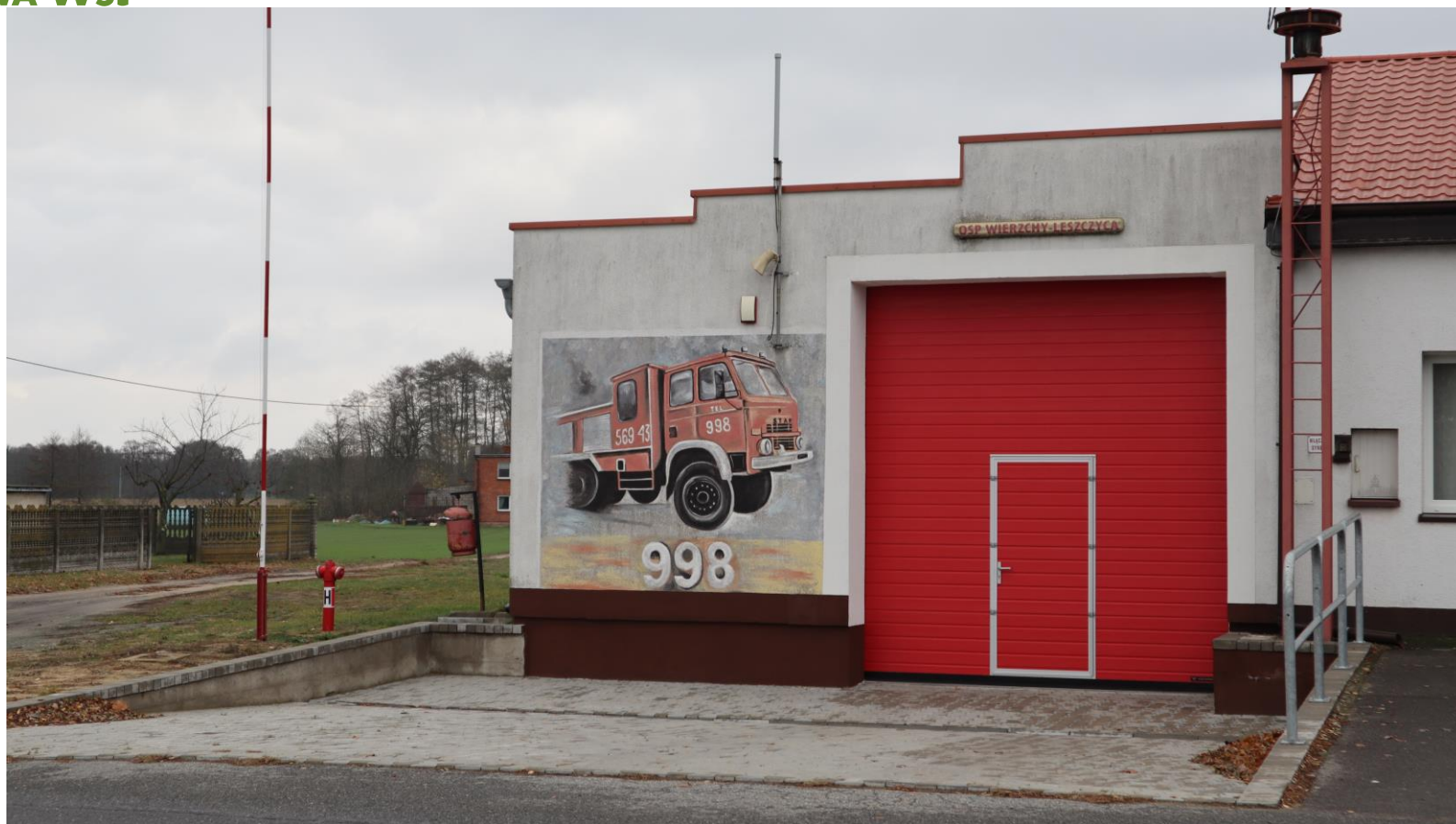
Remiza Ochotniczej Straży Pożarnej w Wierzchach