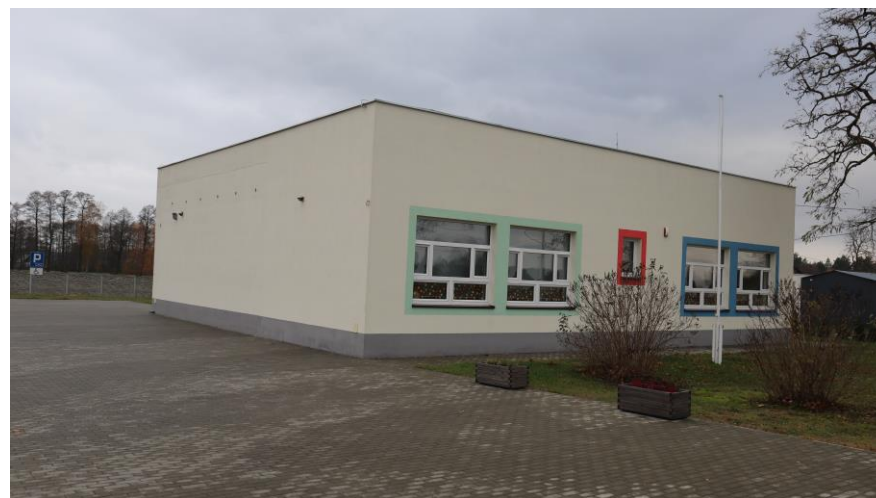
Przedszkole w Wierzchach