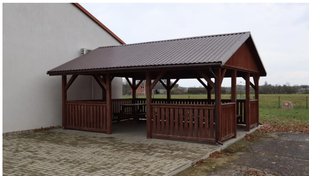
Wiata drewniana przy Sali Wiejskiej w Wierzchach